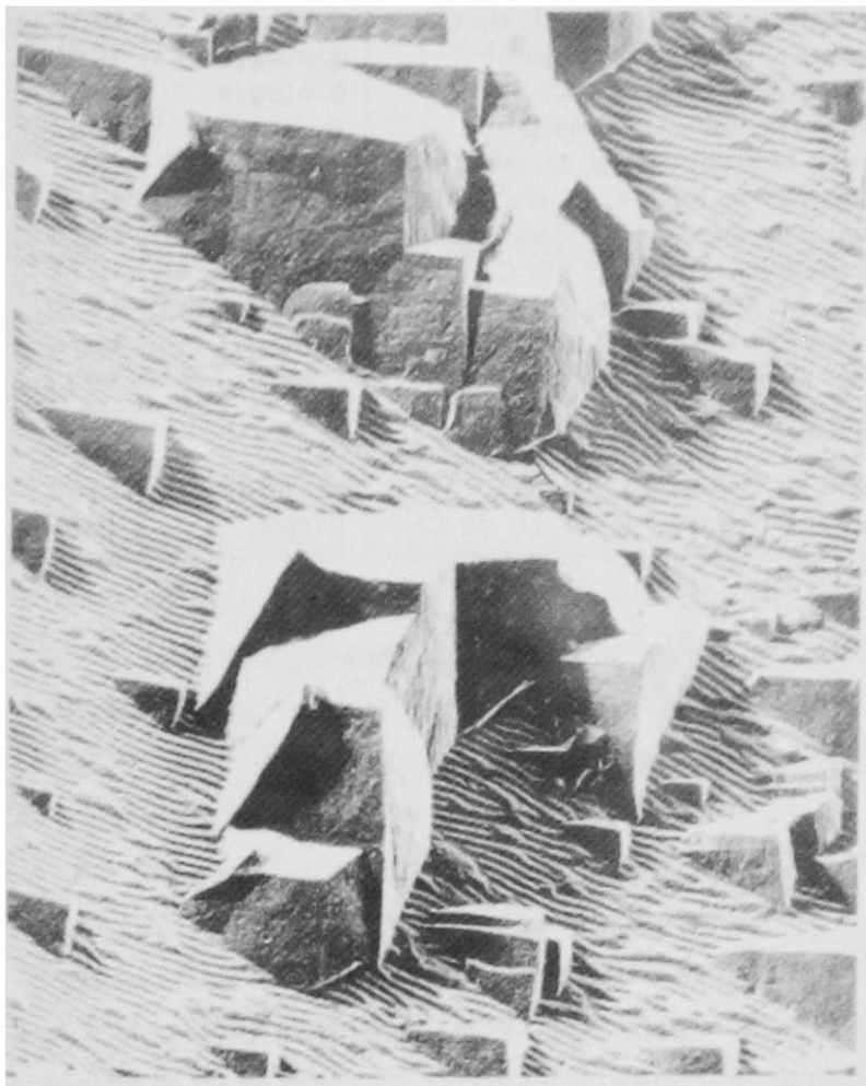
Fig. 2. Aluminio puro deformado visto al microscopio de transmisión. Ataque electroquímico y químico dejando a la vista microfiguras de corrosión. Aumento 5 000 X. De un trabajo del autor.

la serie Elmiskop 1, del cual se han fabricado más de mil, Fig. 1 y Fig. 2), y porque tenemos recién instalado el más moderno microscopio electrónico de barrido: un Siemens-ETEC Autoscan, Fig. 3, con el cual pensamos, como hace 20 años, situarnos a la vanguardia en este campo. Una recopilación de los microscopios existentes en el país, que se presenta en la Tabla 1.1 dará una visión cronológica de conjunto de esta actividad en Chile.