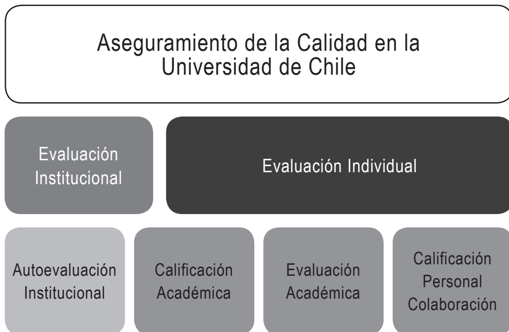
Ilustración 1. Procesos de aseguramiento de calidad

Fuente: Elaboración propia, a partir del Estatuto de la Universidad de Chile (2006), Art. 53°, y el Reglamento del Consejo de Evaluación (2010), Art. 22°.