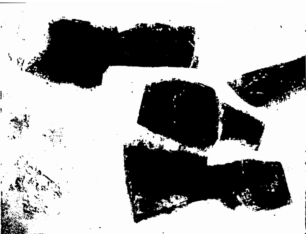
ESCOLLOS, 1960 (colección particular)