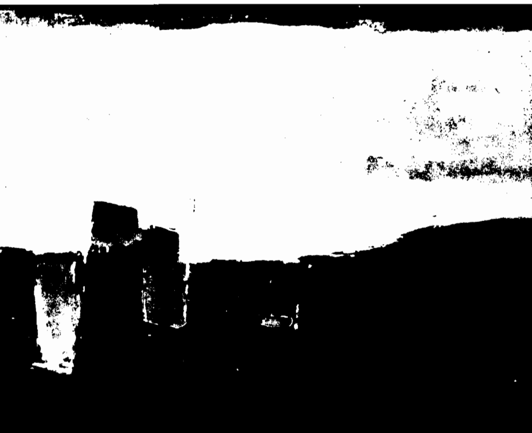
PEQUEÑOS OBJETOS, 1960 (colección particular)