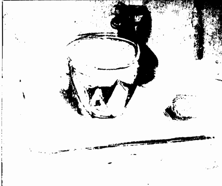
OBJETOS, 1949 (propiedad del artista)