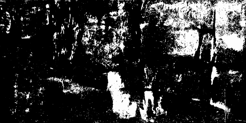
PINTURA, 1960 (colección particular)