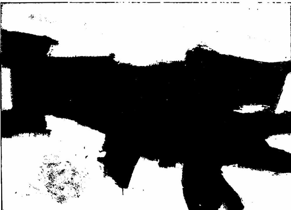
ESCOLLOS, 1961 (propiedad del autor)