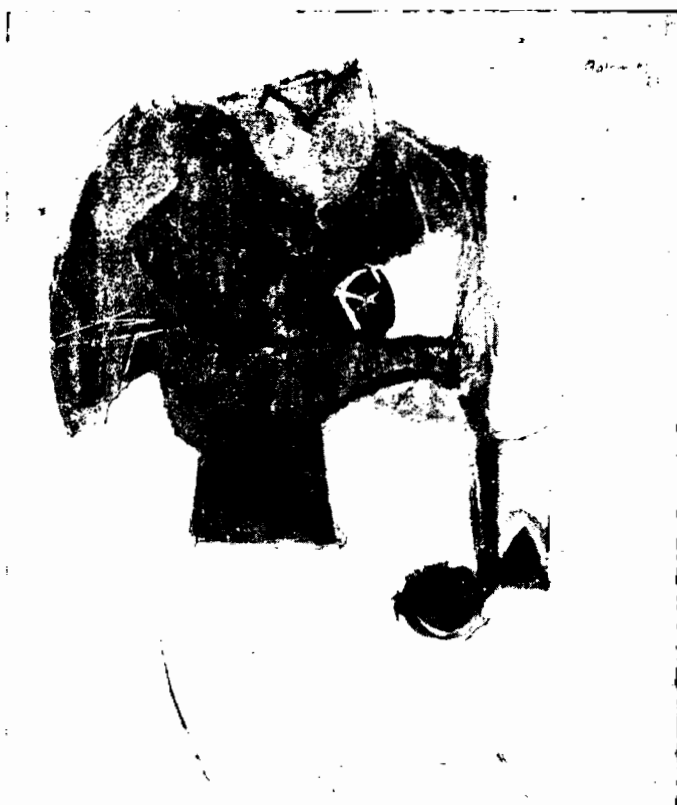
FRUTERO, 1953 (propiedad del autor)